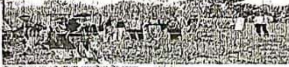
छात्रों द्वारा पौधरोपण कार्यक्रम का शुभारंभ। छात्रों को मतदान की प्रक्रिया के बारे में बताया गया। साथ ही पौधरोपण का कार्यक्रम भी चलाया गया।

कॉलेज में मतदाता जागरूकता एवं पौधरोपण कार्यक्रम का शुभारंभ हुआ। छात्रों को मतदान की प्रक्रिया के बारे में बताया गया। साथ ही पौधरोपण का कार्यक्रम भी चलाया गया।