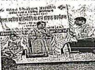
गए जिनका जवाब अतिथियों ने दिया।